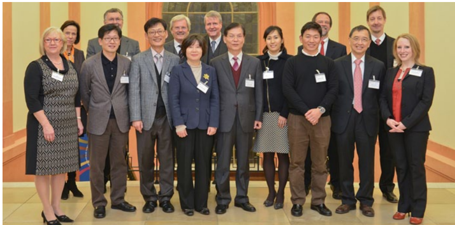
Teilnehmer der Auftaktkonferenz in Halle.

Die Leopoldina und die Korean Academy of Science and Technology (KAST) haben im Frühjahr 2012 ein Memorandum of Understanding unterzeichnet. Mit diesem Kooperationsabkommen erhält die Leopoldina einen besseren Zugang zu einem der wichtigsten Wissenschaftsstandorte in Asien. Zugleich ist KAST zentraler Akteur in der Politikberatung Südkoreas. Vereinbart wurde unter anderem, zukünftig regelmäßig gemeinsame, wissenschaftlich exzellente Konferenzen zu veranstalten. Den Auftakt zu dieser Konferenzreihe machte am 25. und 26. November 2012 die „Founding Conference“ in Halle.