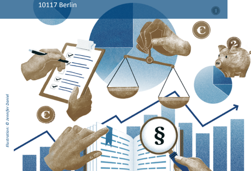
Illustration: © Jennifer Daniel