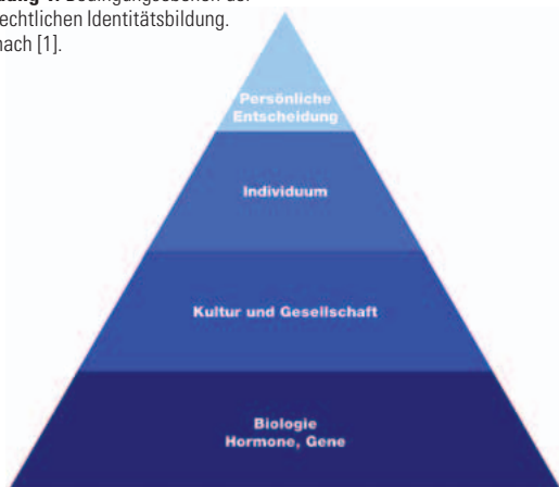
Abbildung 1: Bedingungebenen der geschlechtlichen Identitätsbildung. Mod. nach [1].