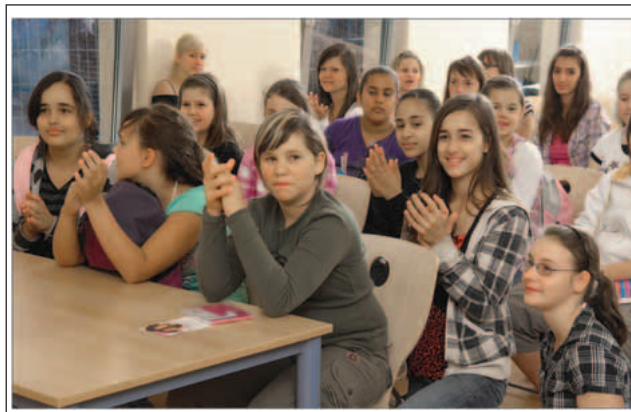
Abbildung 4: Mädchen applaudieren nach dem Gespräch mit der ÄGGF-Ärztin.