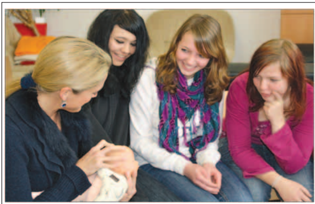
Abbildung 3: Eine ÄGGF-Ärztin erklärt Mädchen Schwangerschaft und Geburt.