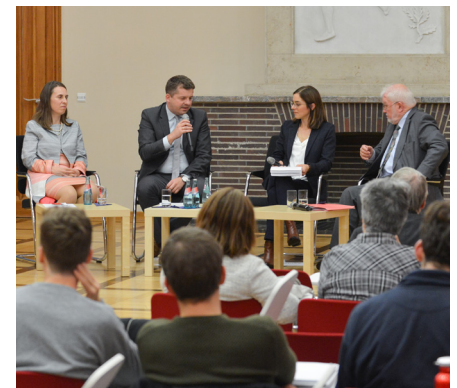
Diskussionsabend „Wie viel Demokratie braucht Europa?“