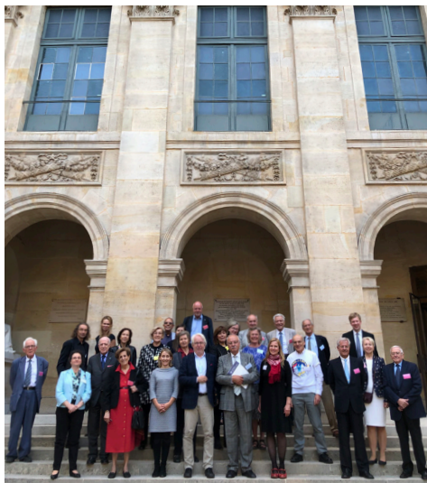
Mitglieder von Leopoldina und Académie des sciences berieten über das Verhältnis von Menschenrechten und Bildung.

In wissenschaftlichen Vorträgen und Gesprächsrunden erörterten die Delegationsmitglieder beider Länder und zahlreiche Interessierte ethische Aspekte der Bildung zu Menschenrechten, die Rolle der Menschenrechte in der Wissenschaft und den Einsatz für verfolgte Wissenschaftlerinnen und Wissenschaftler. Im Weiter-