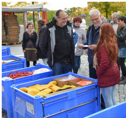
Zum Workshop wurde auch Ausrüstung für die Erstversorgung von Kulturgütern bei Katastrophen gezeigt.

Dabei wurde auch deutlich, dass es neben weiteren finanziellen Mitteln für die Notfallvorsorge vor allem einer verbindlichen Einbindung der Kultureinrich-